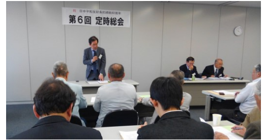
5/22 神奈川県日中総会

◆5/22 神奈川県日中友好協会理事会・総会報告 大縫副会長、春名理事長、上野副理事長出席