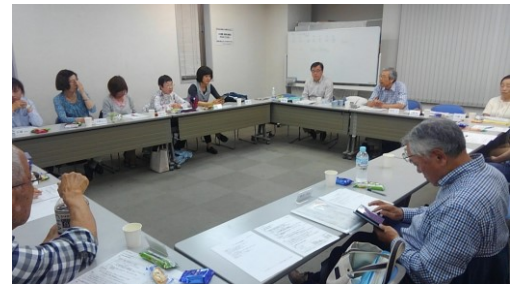
5/23 かわせみ定例会議