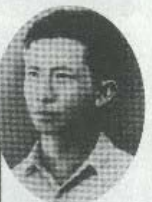
▲聶耳氏 ◀鶴沼海岸の聶耳記念碑